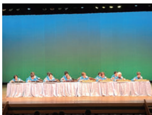
大正琴コスモス会