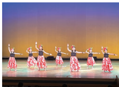
ウアケアフラダンスクラブ

高島文化フェスティバルは、藤樹の里文化芸術会館で開催されてきた「湖西芸能フェスティバル」と、合併を機にスタートし各地区持ち回りで6回開催してきた「文化協会文化祭」をひとつにしたイベントです。(主催：高島文化フェスティバル実行委員会・高島市教育委員会)