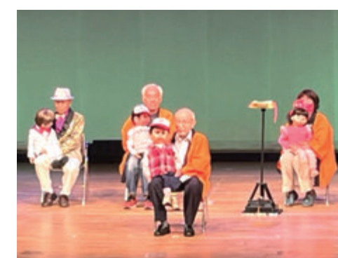
高島腹話術クラブ