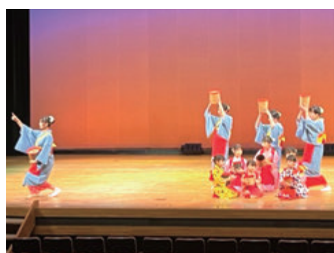
湖島会子供舞踊教室