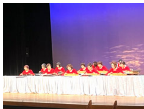
大正琴ひなげし会・琴音クラブ