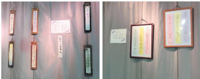
▲今津のリプル内で親愛社と藤苑俳句会の作品を展示▲